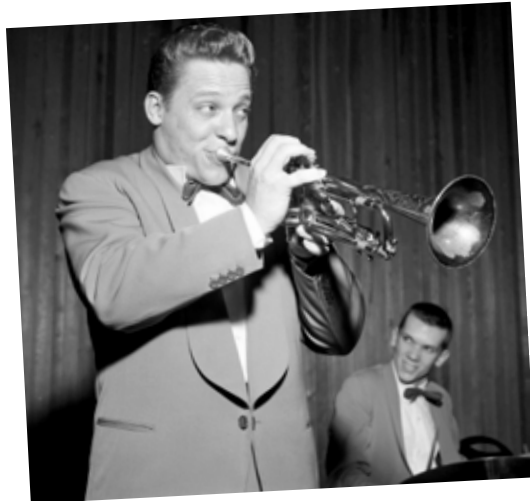
Ernie Englund var den förste i Sverige att spela in rock'n'roll på skiva. Ernie var född i Chicago 1928, men flyttade till Sverige 1944.