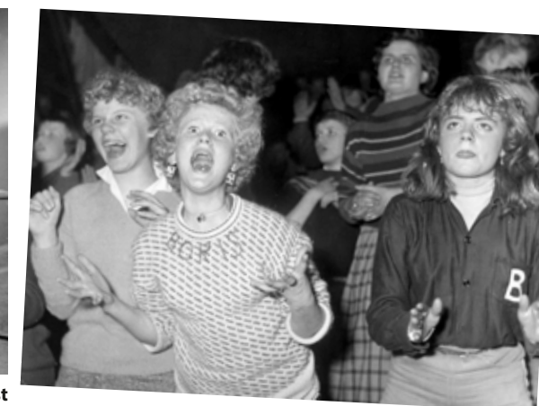
Tonåringarna gick helt loss på våra svenska rock'n'roll-artister.