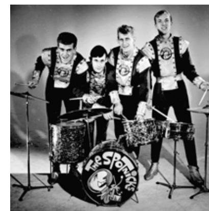
The Spotnicks var ett av Sveriges allra mest populära band utomlands och kör en gammal Hank Williamsklassiker på plattan.