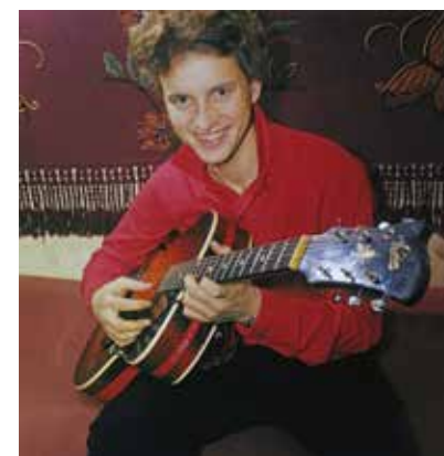
Rock-Boris var en mångsidig musiker, som spelade både i Frälsningsarmén och på rockscenerna i Sverige.

TEXT: KENT VIKMO