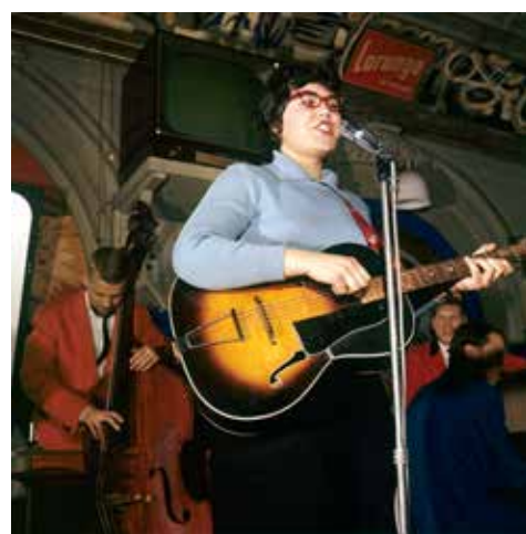
Rock-Olga från Gävle räknas som landets främsta rockdrottning med sin energiska scenshow.