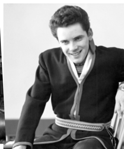
Den Rockande Samen, Sven-Gösta Jonsson, blev en rikskändis med sin speciella stil.